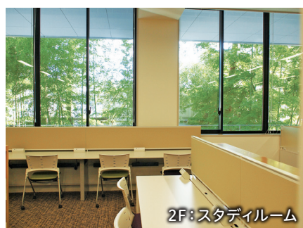
2F: スタディールーム

会話可能なエリア。グループ学習や打ち合わせができます。しっかり蓋のしまる飲み物なら飲んでOK。 雑誌は音楽を中心に主要なタイトルの直近2年分をホールに置いています。 その他にも、キャリア、絵本、音楽小説、音楽マンガなどのコーナーがあります。ソファ席もおすすめ。