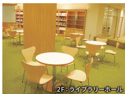
2F: ライブラリーホール