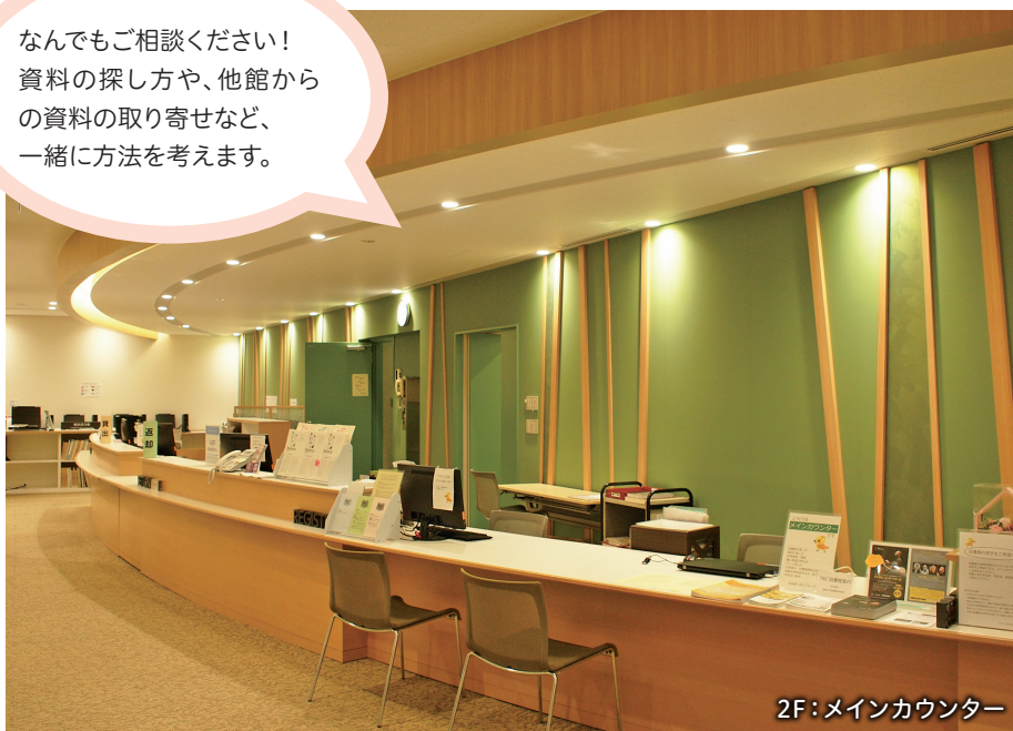
2F:メインカウンター