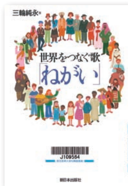
請求記号●J109-564 三輪純永『世界をつなぐ歌「ねがい」』新日本出版

音楽はノンバーバル・コミュニケーションのひとつである。だからこそ、音楽には人を動かす力、世界を変える力があるのではないだろうか。ほら、耳を澄ませてみよう。すると、平和を祈り、愛を語る歌が世界中から聞こえてくるのではないだろうか。